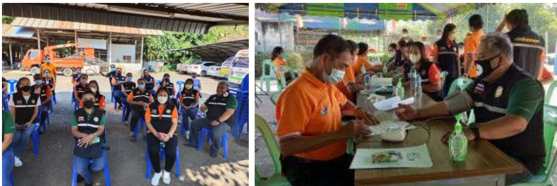
โครงการฉีดวัคซีนป้องกันโรคโควิด - ๑๙ (วัคซีนพระราชทานฯ) เข็มที่ ๒ เมื่อวันที่ ๖ มกราคม ๒๕๖๕ ณ องค์การบริหารส่วนตำบลภูหลวง และประชาสัมพันธ์ทางเว็บไซต์ในวันเดียวกัน