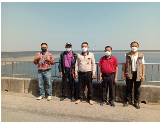
เยี่ยมชมจุดชมวิว เรือนจำชั่วคราวเขาเขื่อนล้น (เรือนจำกลางคลองไผ่) และอ่างเก็บน้ำเขายายเที่ยง ต.ลำตะคอง อ.สีคิ้ว จ.นครราชสีมา เมื่อวันที่ ๑ มีนาคม ๒๕๖๕