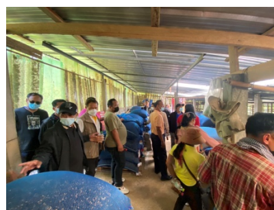
ศึกษาดูงานแหล่งเรียนรู้วิสาหกิจชุมชนกาแฟอาราบิก้าและมะคาเดเมีย แบบประชาอาสาบ้านดงมะไฟ หมู่ที่ ๘ ต.มะเกลือใหม่ อ.สูงเนิน จ.นครราชสีมา เมื่อวันที่ ๑ มีนาคม ๒๕๖๕