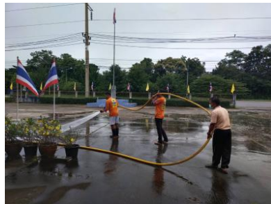
การจัดกิจกรรม ๕ ส. อาคารสถานที่ และบริเวณโดยรอบ อบต. ภูหลวง เมื่อวันที่ ๘ ตุลาคม ๒๕๖๔ และ วันที่ ๑๓ ธันวาคม ๒๕๖๔ และประชาสัมพันธ์ทางเว็บไซต์ในวันที่จัดกิจกรรม