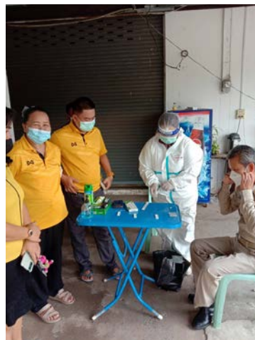
การให้บุคลากรในองค์กรตรวจคัดกรอง ATK ทุกวันจันทร์ เพื่อเป็นการเฝ้าระวัง การป้องกัน และควบคุมการแพร่ระบาดของโรคโควิด - ๑๙