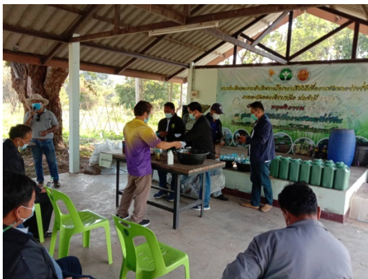
ศึกษาดูงานการแปรรูปผลิตภัณฑ์อาหารจากพืชและสัตว์ เพื่อพัฒนาผลิตภัณฑ์ชุมชน (ต้มอิงกระป๋อง) และการทำการเกษตรแบบชีววิถี