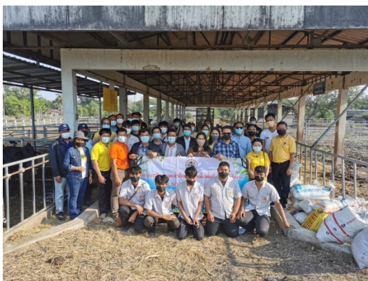
การประยุกต์ใช้เครื่องมือทางการเกษตรเพื่อเพิ่มผลผลิตและลดต้นทุนการเกษตร (เครื่องฟ่นละอองน้ำ) การจัดการฟาร์มเลี้ยงสัตว์ (ฟาร์มเลี้ยงวัวเนื้อ) ณ วิทยาลัยเกษตรและเทคโนโลยีนครราชสีมา เมื่อวันที่ ๒๘ กุมภาพันธ์ ๒๕๖๕