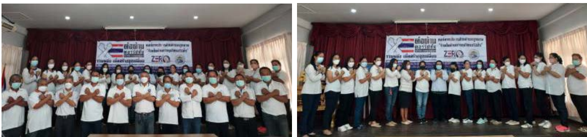
การจัดกิจกรรมวันต่อต้านการทุจริตสากล เมื่อวันที่ ๙ ธันวาคม ๒๕๖๔ ณ ห้องประชุม อบต. ภูหลวง

๖.๑ ตามที่องค์การสหประชาชาติ (United Nation : UN) กำหนดให้วันที่ ๙ ธันวาคม ของทุกปี เป็นวันต่อต้านการทุจริตสากล (Internitional Amti Corroption Day) องค์การบริหารส่วนตำบลภูหลวง ได้จัดกิจกรรมด้านการคอร์รัปชัน เพื่อเป็นการเสริมสร้างวัฒนธรรมองค์กรให้เจ้าหน้าที่ของหน่วยงานมีทัศนคติ ค่านิยม ในการปฏิบัติงานอย่างซื่อสัตย์ สุจริต Type Text here โดยได้ประชาสัมพันธ์ทางเว็บไซต์ อบต. ภูหลวง www.phuluang.go.th > หน้าแรก > หัวข้อข่าวกิจกรรม เมื่อวันที่ ๒๗ มกราคม ๒๕๖๕ ตามรูปภาพการจัดกิจกรรม ดังนี้