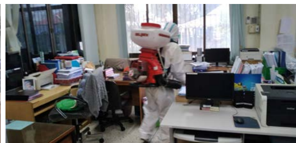
การฉีดพ่นน้ำยาฆ่าเชื้อในอาคารสถานที่ทำงาน อบต. ภูหลวง เป็นประจำ