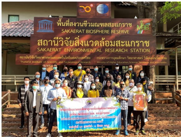
รับฟังการบรรยายพิเศษเกี่ยวกับความเป็นมา และบทบาทหน้าที่ของสถานีวิจัยสิ่งแวดล้อมสะแกกราช

๒) ได้ดำเนินโครงการฝึกอบรมและศึกษาดูงานเพื่อเพิ่มศักยภาพพนักงาน ลูกจ้าง สมาชิกสภา อบต. และผู้นำชุมชน องค์การบริหารส่วนตำบลภูหลวง อำเภอปักธงชัย จังหวัดนครราชสีมา ประจำปีงบประมาณ พ.ศ. ๒๕๖๕ ระหว่างวันที่ ๒๘ กุมภาพันธ์ - ๑ มีนาคม ๒๕๖๕ จำนวน ๔๐ คน ในพื้นที่ จังหวัดนครราชสีมา โดยได้ประชาสัมพันธ์ทางเว็บไซต์ อบต. ภูหลวง www.phuluang.go.th > หน้าแรก > หัวข้อข่าวกิจกรรม เมื่อวันที่ ๗ มีนาคม ๒๕๖๕ ตามรูปภาพการดำเนินโครงการ ดังนี้