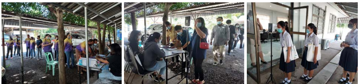
การจัดให้มีเครื่องตรวจวัดอุณหภูมิและเจลแอลกอฮอล์ ไว้ตรวจคัดกรองก่อนเข้าทำงาน เข้าร่วมประชุม/สัมมนา/ฝึกอบรม/กิจกรรม และเครงครัดให้สวมหน้ากากอนามัย ๑๐๐%